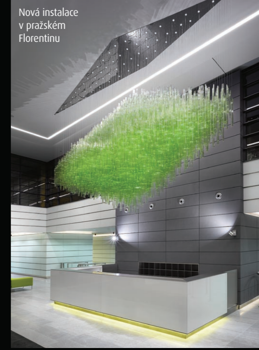
Nová instalace v pražském Florentinu