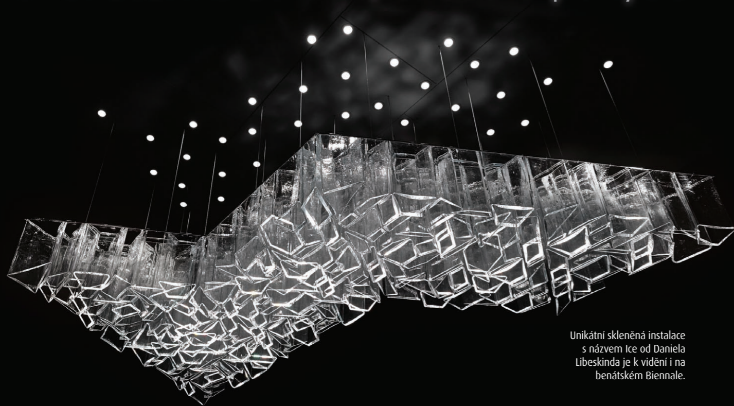
Unikátní skleněná instalace s názvem Ice od Daniela Libeskinda je k vidění i na benátském Biennale.