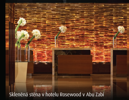
Skleněná stěna v hotelu Rosewood v Abu Zabí